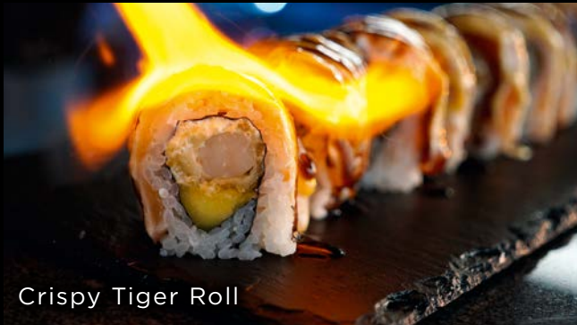
Crispy Tiger Roll