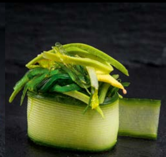
Green Tower Gunkan