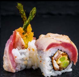
Yaka's Secret Roll