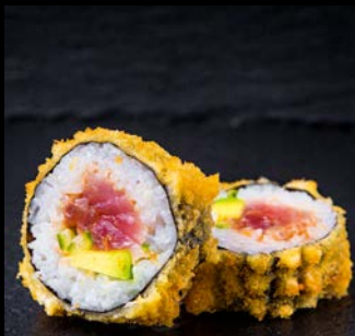
Hot Maguro Age