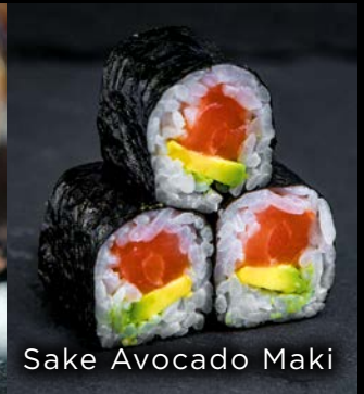
Sake Avocado Maki