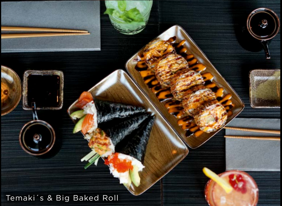
Temaki's & Big Baked Roll